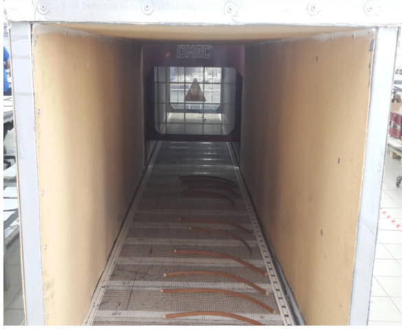
Öncesi Kurutma Fırını Çıkış