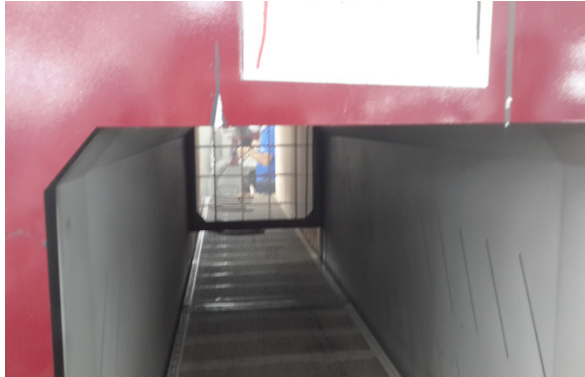
Öncesi Kurutma Fırını Giriş