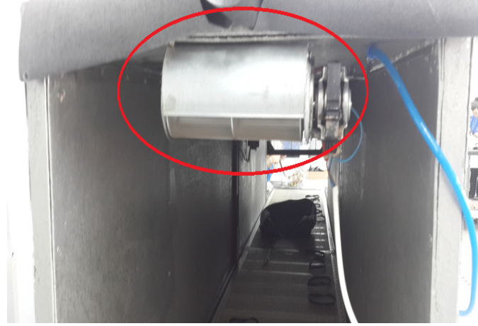
Sonrası Kurutma Fırını Çıkış