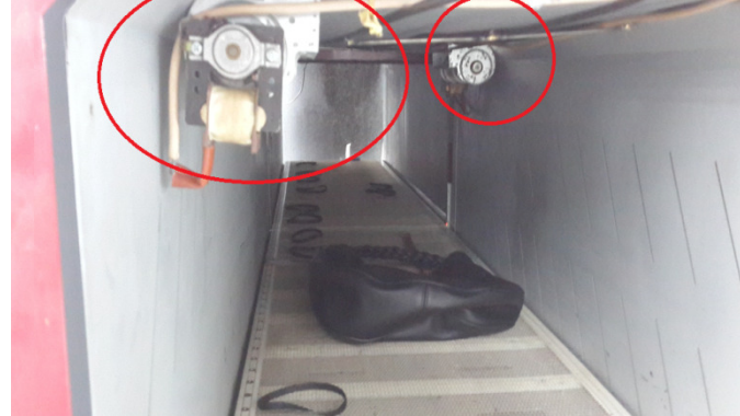
Sonrası Kurutma Fırını Giriş