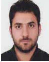
MAHMUT ŞİMŞEK DİYARBAKIR