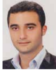
EROL BİNBİR DİYARBAKIR