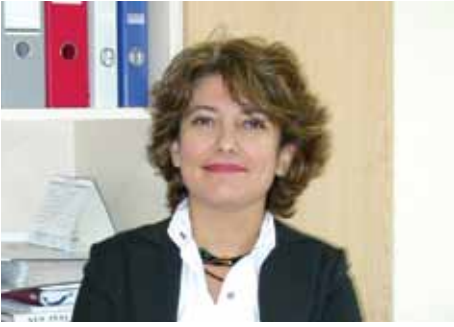
Röportajımıza başlamadan önce kısaca sizi tanıyabilir miyiz? Teskon'daki geçmiş dönemdeki ve bugünkü görevleriniz hakkında da kısaca bilgi alabilir miyiz?

İzmir Yüksek Teknoloji Enstitüsü Makina Mühendisliği Bölümü öğretim üyesi ve Enerji Mühendisliği Anabilim Dalı Başkanıyım. 1993 yılında ilki gerçekleştirilen Ulusal Tesisat Mühendisliği Kongresinde çiçeği burnunda bir doktora öğrencisiydim ve Kongrede bildiri sunanlara katılım belgesi vermekle görevliydim. İlk kez böyle büyük bir organizasyonda görev almış olmanın verdiği mutluluğun yanı sıra Kongrede sergiye katılan bir jeotermal enerji firması ile tanışmam, bu alana yönelmemi sağladı ve hayatımın akışını tamamen değiştirdi. Doktora konusu olarak Jeotermal Enerjiyi seçtim, yurtdışında bu alanda eğitim ve araştırma yapma olanakları buldum. Şu anda kariyerimi hem jeotermal enerji hem de son 10 yıldır binalarda enerji performansı alanında sürdürüyorum. İnaniyorum ki aradan geçen 18 yıl içinde Tesisat Mühendisliği Kongreleri benim gibi akademik hayatına yön vermeye çalışan yada sektörde çalışma alanı arayan pek çok gence yol göstermiştir.