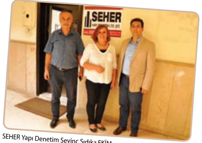
SEHER Yapı Denetim Sevinç Sıdika EKİM