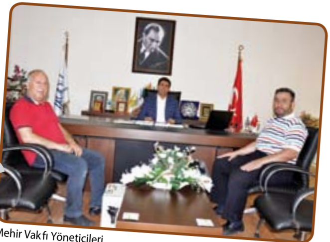
Mehir Vakfı Yöneticileri