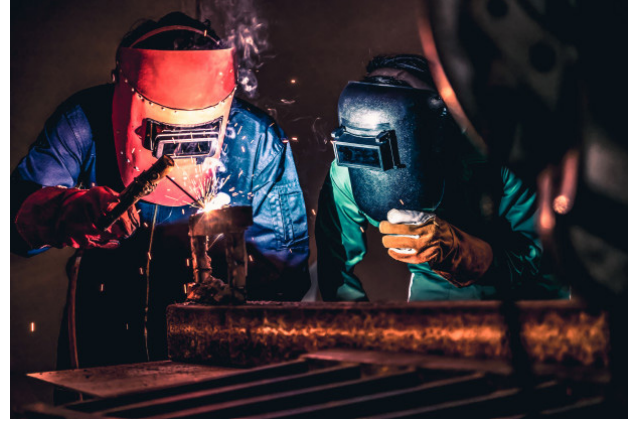
Kaynak Teknolojisi Alanında Çalışan Personelin Niteliği ve Eğitimde Modern Yöntemler