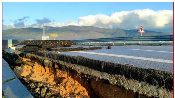
Şekil 8. Hatay Havaalanı Pist Yolu - 3