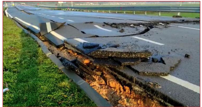
Şekil 7. Hatay Havaalanı Pist Yolu - 2

Kahramanmaraş, Hatay Havalimanları hasar nedeniyle uçuşa kapalıdır. (AFAD Basın Bülteni-7) ◀◀