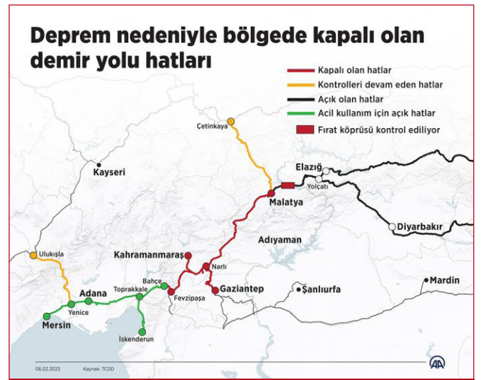
Şekil 5. Deprem Nedeniyle Bölgede Kapalı Olan Demiryolu Hatları

AA muhabirinin Ulaştırma ve Altyapı Bakanlığı Türkiye Cumhuriyeti Devlet Demiryolları Genel Müdürlüğünden aldığı bilgilere göre, Kahramanmaraş merkezli depremlerden 1275 kilometre demiryolu hattı etkilenirken, bu hatlar üzerinde 446 köprü, 6161 menfez, 175 tünel bulunuyor.