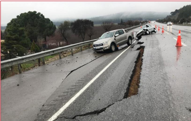
Şekil 3. Kahramanmaraş - Pazarcık Yolu

Hatay Kırıkhan-Belen arası yolda çökme olduğundan dolayı ulaşıma kapalıdır. Adıyaman Gölbaşı-Malatya arası heyelan ve tünelde beton dökülmesi olduğundan dolayı ulaşıma kapalıdır. (AFAD Basın Bülteni-8)