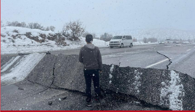
Şekil 2. Malatya - Adıyaman Yolu

Hatay-Reyhanlı devlet yolu tamamen ulaşıma kapalıdır. (AFAD Basın Bülteni-10)