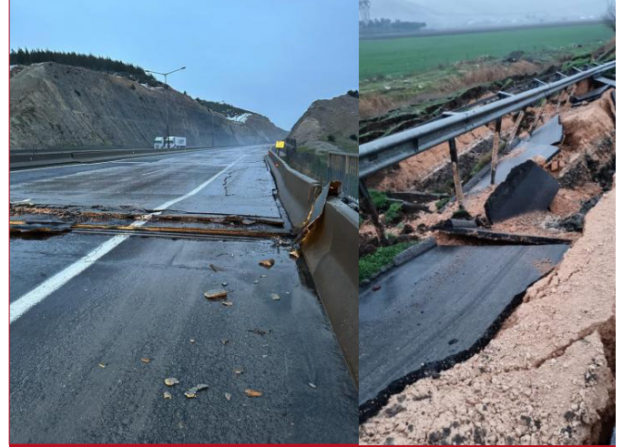
Şekil 1. Gaziantep - Osmaniye Karayolu