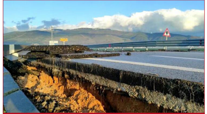
Şekil 6. Hatay Havaalanı Pist Yolu - 1