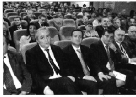
19 Kasım 2005/Evrensel

"Bunlar da bilimsel olarak, bilimsel olarak desteklenmelidir" dedi. Mühendislik Eğitimi Sempozyumunda konuşan TMMOB Başkanı Mehmet Soğanca, Şemdinli'nin bilim için aydınlatılması gerektiğini söyledi. Genel Yürütme Kurulu Başkanı Mehmet Soğanca, "Bunlar da bilimsel olarak, bilimsel olarak desteklenmelidir" dedi.