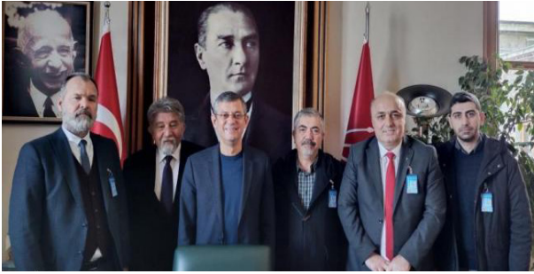
Kamuda Çalışan Mühendis, Mimar ve Şehir Plancılarının Özlük Hakları ve Ekonomik Talepleri ile İlgili Hazırlanan Kanun Teklifleri Milletvekillerine İletildi