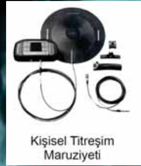
Kişisel Titreşim Maruziyeti