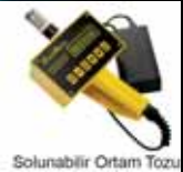
Solunabilir Ortam Tozu

İş Sağlığı ve Güvenliği Kanunu, Madde 10'a göre; (4) İşveren, iş sağlığı ve güvenliği yönünden çalışma ortamına ve çalışanların bu ortamda maruz kaldığı risklerin belirlenmesine yönelik gerekli kontrol, ölçüm, inceleme ve araştırmaların yapılmasını sağlar. Bu kapsamda Merkez Laboratuvarı tarafından gerekli ölçüm ve analizler akredite olarak yapılacaktır. Çalışma ve Sosyal Güvenlik Bakanlığı tarafından yayınlanan mevzuatlar gereği yapılacak İŞ HİJYENİ ölçümleri: