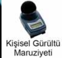
Kişisel Gürültü Maruziyeti