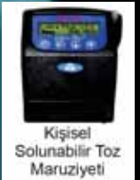
Kişisel Solunabilir Toz Maruziyeti