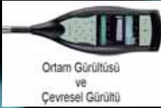
Ortam Gürültüsü ve Çevresel Gürültü