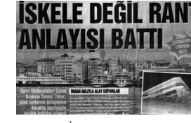
Karaköy İskelesinin batışı ile ilgili basın açıklaması haberi Kent Yaşam Gazetesi

Arife gününde ağır bilanço Yarınki gün meydana gelen trafik kazalarında 18 kişi ölümlü, 124 kişi yaralandı. Kayırtı, Konya, Nevşehir, Bursa, Kocaeli, Gaziantep, Aydın ve Tokat'da da ölümlü kazalar meydana geldi.