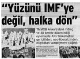
22 Kasım Miting Haberı Birgün Gazetesi