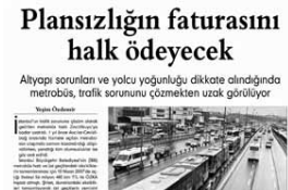
Metrobüs Basın Bültenimizden haberi Evrensel Gazetesi

TMMOB kazalara karşı önlem almaya çağırdı TÜRKİYE'DE her yıl karayollarında meydana gelen kazalar nedeniyle yaklaşık 5 bin kişinin hayatını kaybettiğine dikkat çeken Makine Mühendisleri Odası, sürücüler ve yetkililerle kazalara karşı gereken önemi alma konusunda çağrıda bulundu.