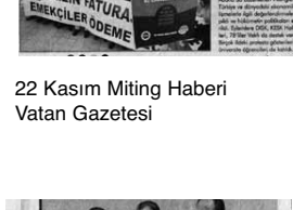
22 Kasım Miting Haberı Vatan Gazetesi

Karaköy battı, İDO 'başarı' ödülü aldı Karaköy İskelesinin batışı ile ilgili basın açıklaması haberi Birgün Gazetesi