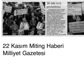
22 Kasım Miting Haberı Milliyet Gazetesi