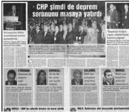
Deprem Sempozyumu, 1. Çelik Kent Yaşam Gazetesi