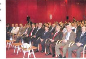
Asansör Sempozyumu, Teknik Mühendisleri Odası ve Makina Mühendisleri Odası'nın girişimleriyle bir organizasyonu olarak, 23-25 Mayıs tarihleri arasında, Milli Pazar Alanı'nda gerçekleştirilecek.

Bildiriler oturumları Sektörün her kesiminden gelen akademik, teknik uzmanlar ve bilim 2008 yılının teknik bilginin sunulacağı oturumları düzenlenecek.