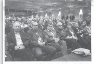
TMMOB Makina Mühendisleri Odası'nın 42. Dönem Olağan Genel Kurulu, dün DSİ Genel Müdürlüğü Konferans Salonunda başladı.