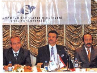
"Yapısal sorunlar sektöri etkiliyor" Sektörün sorunlarının hükümet tarafından çözümlenmesi için toplantı yapıldı. "Makina Sanayi Sektör Platformu", Genişletilmiş Başkanlar Kurulu toplantısında. Sorunlar masaya yatırıldı Toplantıda, platformu oluştur-

Makina sektöründe güç birliği yapması ve ortak akla stratejik kararların alınmasını sağlamak amacıyla 27 farklı devlet, oda, birlik ve organize sanayi bölgesi tarafından Otta Anadolu İhracatçı Birlikleri Makina ve Aksamları İhracatçıları Birliği (OABI) öncülüğünde kurulan "Makina Sanayi Sektör Platformu", Genişletilmiş Başkanlar Kurulu toplantısını Devlet Bakanı Karsad Tüzmen'in katılımlıyla 12 Mart'ta Ankara'da gerçekleştirdi. Toplantıda özellikle, yeni yatırımlar için altyapıya tamamlanmış arazi, bütçeye ve yatırım maliyeti ile yatırım arazi eleman sorununa dikkat çekildi.