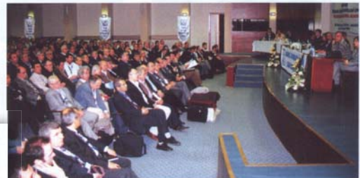
Nisan 2008 EMO Makina Market