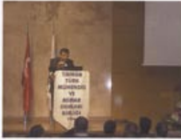
TMMOB Başkanı Emin Karamaz