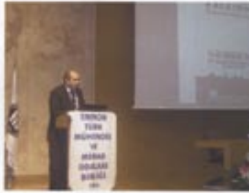
TMMOB Başkanı Mehmet Soğancı