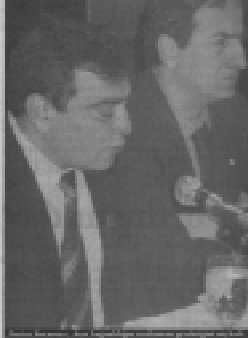
Doğalgaz üretimi artırılmalı