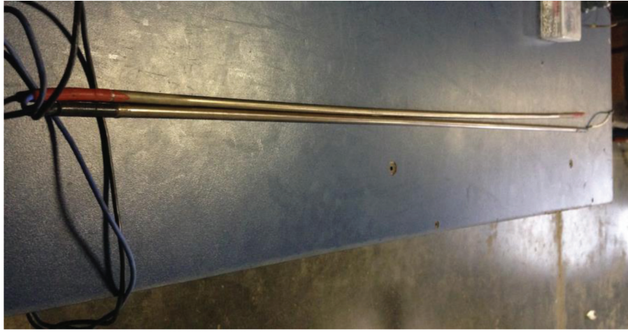
Resim 2. 1 Numaralı Isıtıcı

Bu çalışmada ısıtıcılar, yüzey sıcaklıkları 400 °C