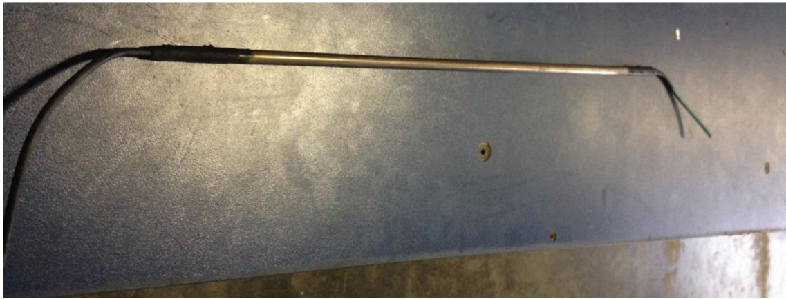
Resim 3. 2 Numaralı Isıtıcı