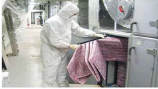
Figure 9: Personal protection equipment for filter replacement

Not: Tüm KKD'ler pandemi şartlarında kullanım talimatlarına uygun kullanılmalı ve bertaraf edilmelidir.