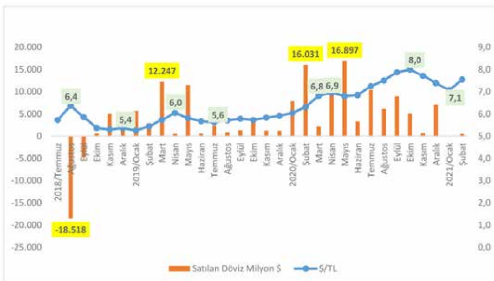
Grafik 5. Aylık Döviz Satışı ve Dolar/TL: 2018-2021

- Hazine, Merkez Bankası ve diğer kamu kuruluşları adına yapılan dış borç ödemeleri ve diğer transferler, Hazine'nin döviz ve altın cinsinden iç borçları için yaptığı ödemeler, enerji KİT'lerine yapılan satışlar ile Bankaların