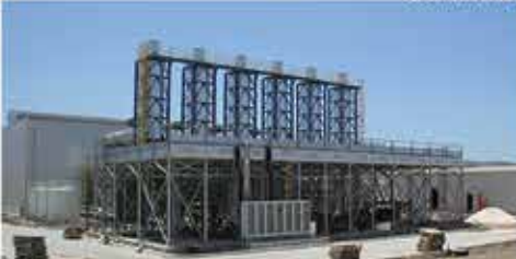
TİRENDA DOĞALGAZ ÇEVİRİM SANTRALİ